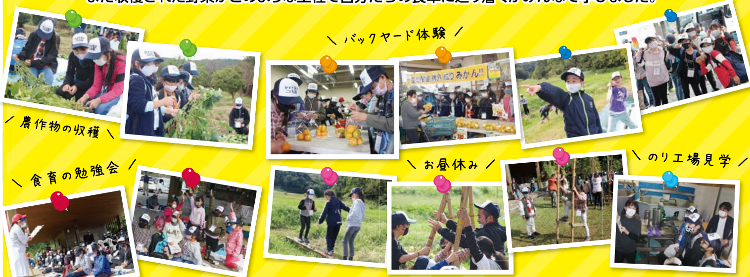
バックヤード体験

10月度の農業収穫体験では生産者が育てた野菜を実際に手で触れながら収穫し、また収穫された野菜がどのような工程で自分たちの食卓に辿り着くかみんな学びました。