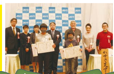
給食センター長賞